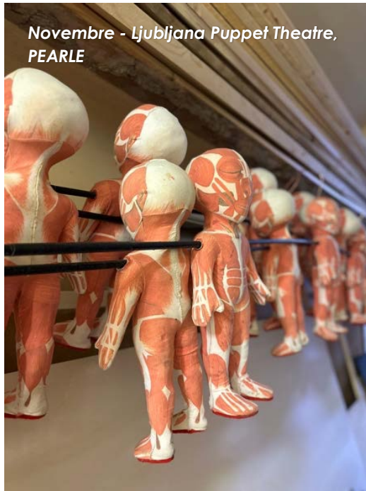
Novembre - Ljubljana Puppet Theatre, PEARLE

En plus de cette journée, les Personnes de Contact (PerCos) de la solution FRAS F4S ont reçus des informations sur la Sécurité sous la forme d'un POINT Sécu F4S. Un espace numérique est également disponible pour les PerCos afin qu'il puisse retrouver toutes les références et informations utiles en matière de prévention des accidents et maladies professionnelles.