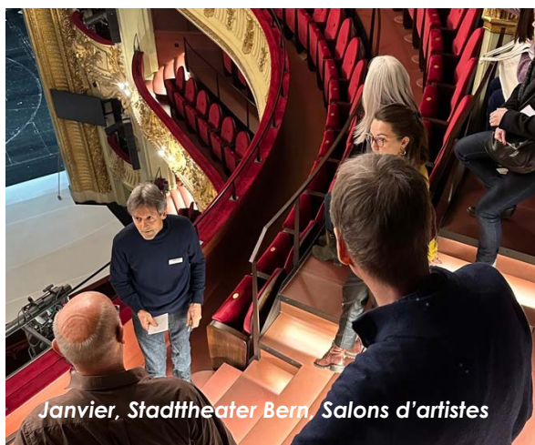
Janvier, Stadttheater Bern, Salons d'artistes