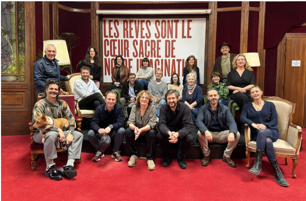
Dernière Assemblée générale de l'UTR

En 2024, ces deux associations historiques ont été dissoutes et les théâtres romands sont devenus membres directs et à part entière de la FRAS . Ces changements institutionnels et statutaires ont été adoptés à une très large majorité lors des différentes assemblées générales des 7 mars et 12 mars 2024.