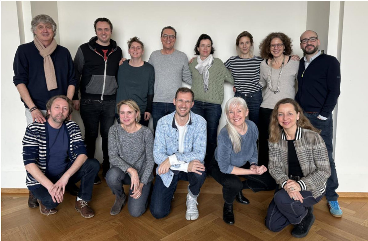
La dernière assemblée du Pool de Théâtres Romands

cet esprit, elle met au cœur de ses préoccupations la création et la diffusion des œuvres créées. Elle participe aux politiques culturelles et représente les théâtres romands au sein de l'UTS et de Pearle – Live Performance Europe.